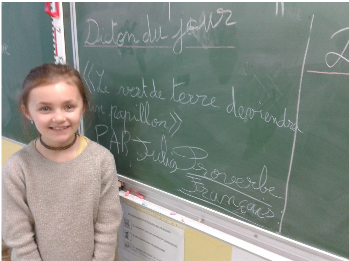
Proverbe de J.